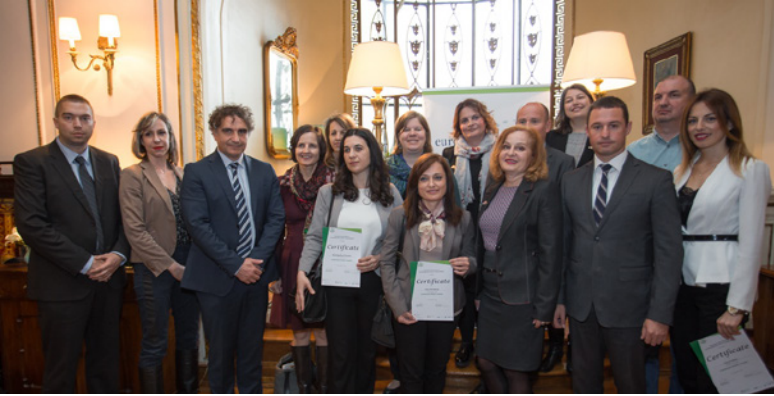
Представници МРЕ, SECO, пилот општина и чланови тима Церемонија приступања Асоцијацији Европска енергетска награда